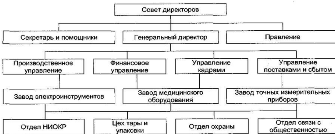
Рисунок 2 – Организационная структура предприятия

Задача 20. Инструкция: найти и отметить единственный правильный ответ на вопрос и обведите его в кружок.