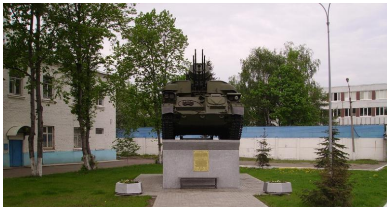
У проходной завода МЕТРОВАГОНМАШ

Уже позже, когда эту импровизированную таможенную перенесли в Москву, Мытищи приобрели статус совершенно самостоятельного поселения, где люди в основном занимались рыбным промыслом и земледелием. Можно без преувеличения сказать, что экология моего города — одна из самых здоровых в Подмосквье, несмотря на наличие заводов. По большей части, это обусловлено тем, что транспортная система в Мытищах почти не допускает въезда транспорта в центр, таким образом, сохраняя благоприятный микроклимат. Конечно, это вызывает ряд трудностей с передвижением, но это небольшая цена за то, чтобы люди чувствовали себя комфортно и не страдали от плохой экологии. На территории Мытищ расположено несколько крупных производств. Одним из таких является машиностроительный завод , который обеспечивает большую часть населения рабочими местами. Основная его специализация — это производство вагонов метро. Его можно считать самым крупным заводом такого направления. Все вагоны метро, которые эксплуатируются в Московском метрополитене, выпускает именно машиностроительный завод в Мытищах .