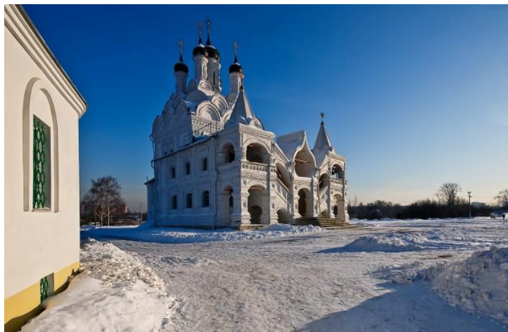
Церковь Благовещения в городе Мытищи

Уже позже, когда эту импровизированную таможенную перенесли в Москву, Мытищи приобрели статус совершенно самостоятельного поселения, где люди в основном занимались рыбным промыслом и земледелием. Можно без преувеличения сказать, что экология моего города — одна из самых здоровых в Подмосквье, несмотря на наличие заводов. По большей части, это обусловлено тем, что транспортная система в Мытищах почти не допускает въезда транспорта в центр, таким образом, сохраняя благоприятный микроклимат. Конечно, это вызывает ряд трудностей с передвижением, но это небольшая цена за то, чтобы люди чувствовали себя комфортно и не страдали от плохой экологии. На территории Мытищ расположено несколько крупных производств. Одним из таких является машиностроительный завод , который обеспечивает большую часть населения рабочими местами. Основная его специализация — это производство вагонов метро. Его можно считать самым крупным заводом такого направления. Все вагоны метро, которые эксплуатируются в Московском метрополитене, выпускает именно машиностроительный завод в Мытищах .