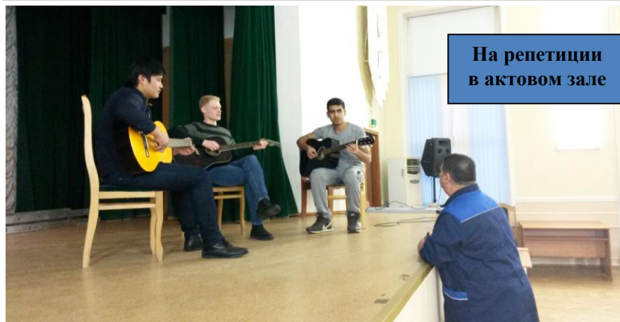
На репетиции в актовом зале