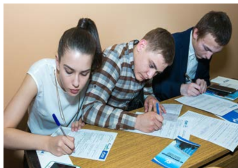
Студенты выпускных групп заполняют анкеты