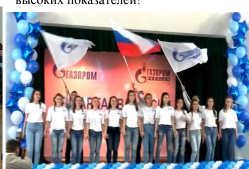
Мы – новое поколение! Мы – достойная смена!