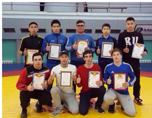
Республиканский турнир «Мем прос» среди юношей 2000 года рождения