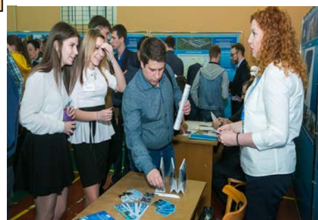
Студенты задавали вопросы и получали исчерпывающие ответы

В настоящее время на предприятиях ПАО «Газпром» требуются работники, которые не просто могли бы сочетать деятельность «узких» специалистов, но и справились бы с проблемными управленческими и производственными задачами. Необходимы настоящие специалисты! И главная задача колледжа состоит в том, чтобы обеспечить студентам глубокие и прочные знания, сформировать сознательное отношение к труду, способствовать приобретению профессиональных компетенций в процессе обучения и прохождения производственной практики.