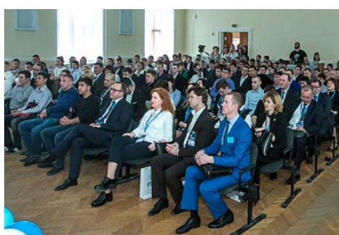
Во время торжественной части на Ярмарке вакансий