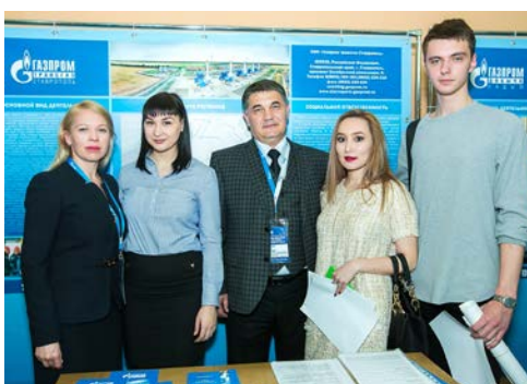
Представители «Газпром трансгаз Ставрополь» и студенты колледжа

13 апреля 2017 года состоялась шестая «Ярмарка вакансий» в ЧПОУ «Газпром колледж Волгоград». Этому событию ждали все студенты нашего колледжа. Главный вопрос, который задают выпускники, - «Куда пойти работать?» Получение образования — это только первый, хотя и трудный этап взрослой жизни. И что же делать дальше? О том, как искать работу современному молодому специалисту говорили на Ярмарке вакансий. День выдался торжественный и очень насыщенный. Состоялись сразу три мероприятия в колледже: совещание по функционированию Образовательного кластера, конкурс «Рабочие стипендиаты Газпромбанка» и, конечно, сама Ярмарка вакансий.