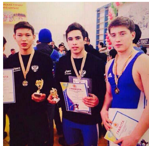
Республиканский турнир среди юношей 1998-2000 года рождения