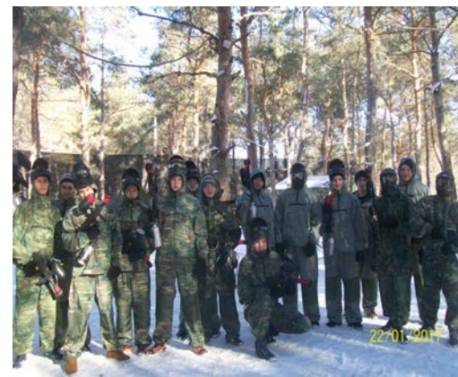
Вся группа - в сборе

Выбирайте, где поиграть в пейнтбол, и наслаждайтесь процессом!