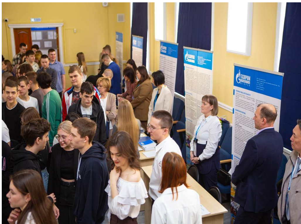
На фото: встреча с представителями отделов кадров дочерних обществ ПАО «Газпром»

Такая широкая вовлеченность в жизнь профессионального сообщества формирует не только позитивный образ, престиж работы по специальности, но и гарантирует закрепление востребованного молодого специалиста в дочерних обществах и организациях ПАО «Газпром».