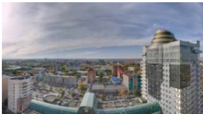
Современный вид города Благовещенска